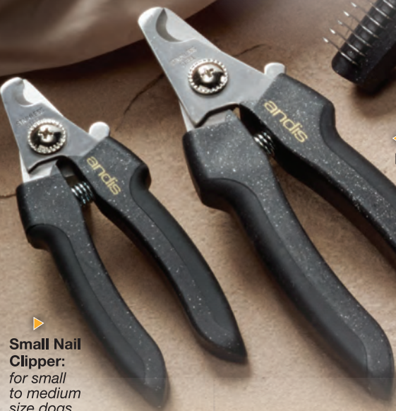
Small Nail Clipper: for small to medium size dogs