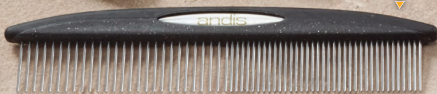
7 1/2" Steel Comb